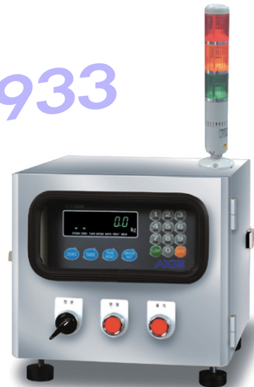
AFP 01DS (Stainless Steel 구조)