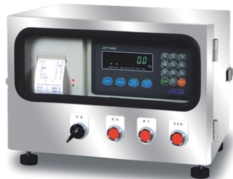
AFP 03PS (Stainless Steel 구조)