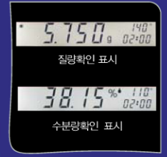
간단한 화면 표시