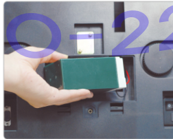
배터리 최대 80시간 사용 가능 ▲

EC 시리즈는 충전식 전지를 사용하여 옥외에서도 사용 가능합니다. 한번 충전 시 최대 80시간까지 연속 사용하실 수 있습니다.