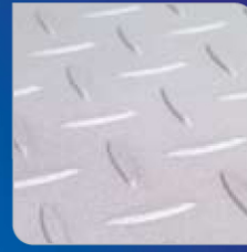
미끄럼 방지 표면