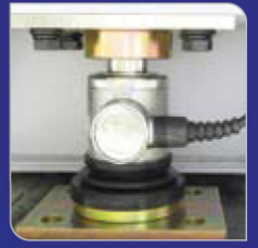
쉽고 간편한 로드셀 장착