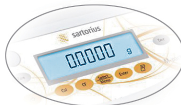
밝고 선명한 디스플레이 (AX Series)