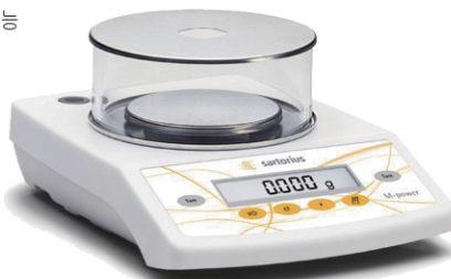
Min : 0.0001g (0.1mg)