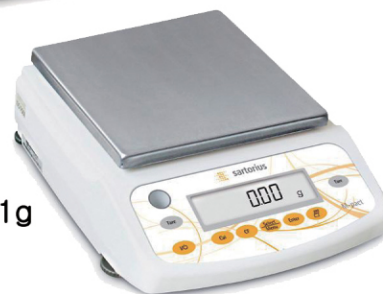
Min : 0.01g