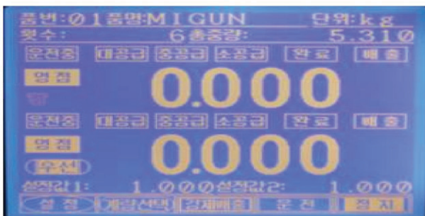
MG200 (2연식 TOUCH CONTROLLER)