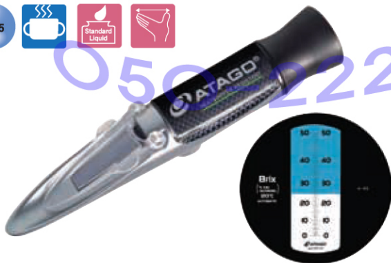
MASTER - 50H