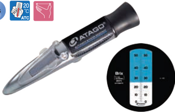
MASTER - 53α