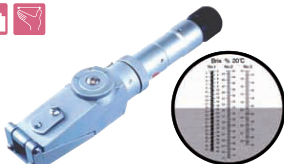
HSR - 500