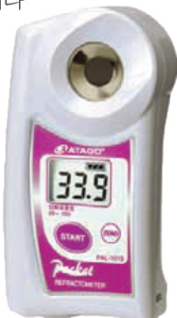
PAL - 102S