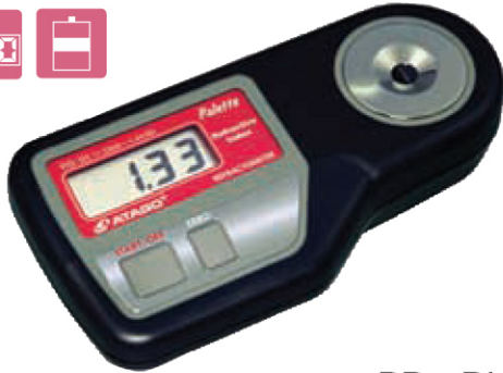
PR - RI