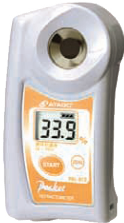
PAL - 97S