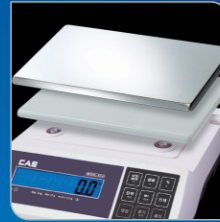
플라스틱, 스테인레스 집판사용