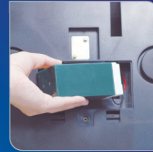
충전식 배터리 사용