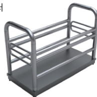
우형가: 축산계량의 필수품 맞춤형 우형기