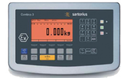
Sartorius Combics 방폭 인디케이터 CIXS3