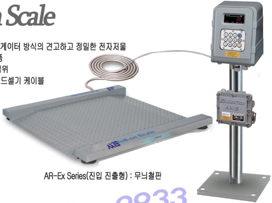
AR-Ex Series(진입 진출형) : 무늬철판