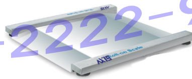
ARS-Ex Series(진입 진출형) : All Stainless Steel