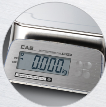
▲ Rear Display