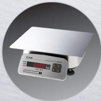
▲ Large Tray