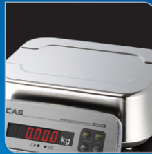
Stainless steel 짐판