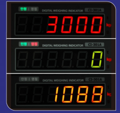
3색 LED 디스플레이 (적색, 녹색, 황색)