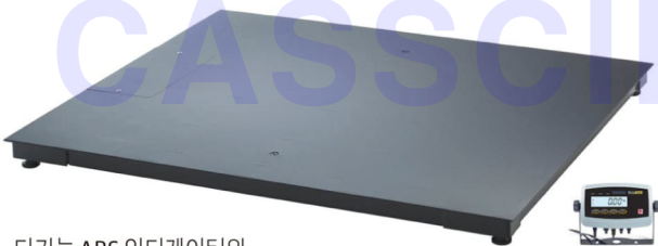
다기능 ABS 인디케이터와 IP68 방수 스테인리스 로드 셀이 장착된 도장강판 플랫폼