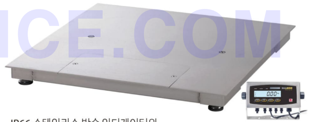
IP66 스테인리스 방수 인디케이터와 IP68 스테인리스 방수 로드셀이 장착된 스테인리스 강판 플랫폼