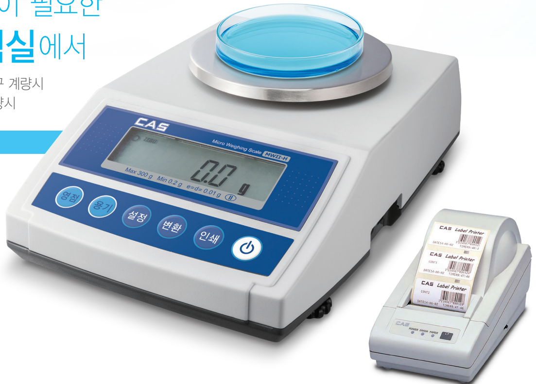
라벨 프린터 DLP-50 (선택사양)