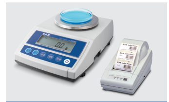
외장형 프린터 연동 가능