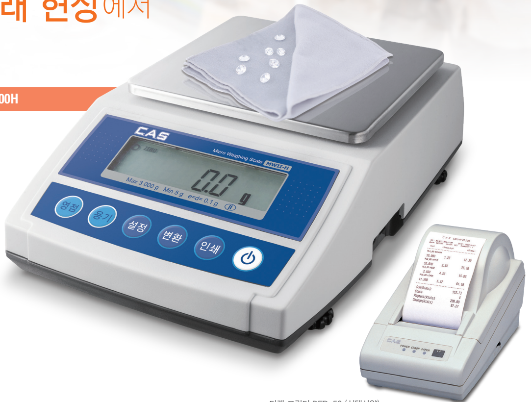
티켓 프린터 DEP-50 (선택사양)