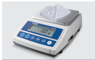
계수 기능 탑재