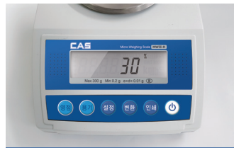
퍼센트 모드 지원