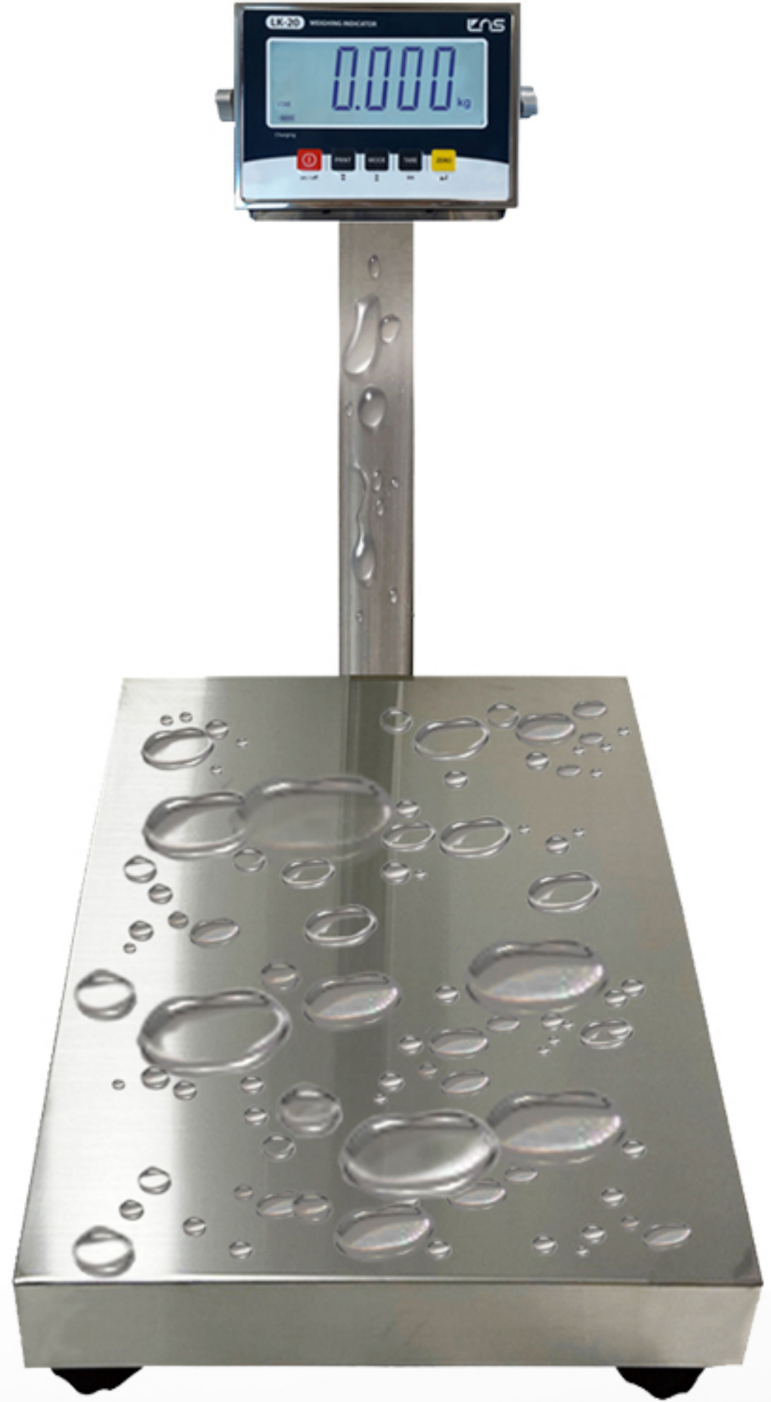
LS Series (L)